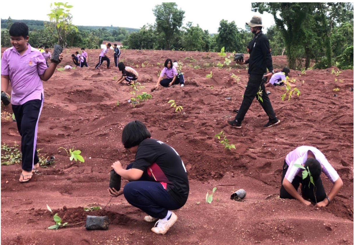
ภาพที่ 17-18 กิจกรรมโครงการอาสาสมัครรักษาดินแดน ประจำปีงบประมาณ พ.ศ. 2565