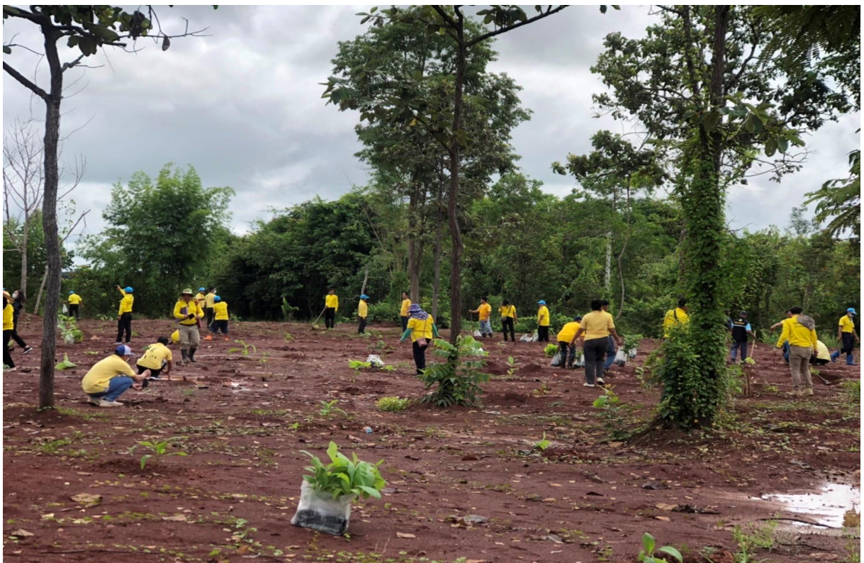
ภาพที่ 3-4 กิจกรรม ปลูกต้นต้นไม้ ตามโครงการท้องถิ่นปลูกป่าเฉลิมพระเกียรติสมเด็จพระนางเจ้าสิริกิติ์ พระบรมราชินีนาถ พระบรมราชชนนี พันปีหลวง "รวมใจท้องถิ่น ปลูกต้นไม้เพื่อแผ่นดิน สืบสานสู่ 90 ล้านต้น"