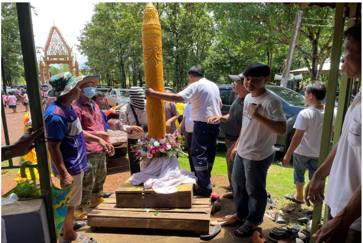
ภาพที่ 5-6 กิจกรรม จัดงานประเพณีวันเข้าพรรษา ประจำปีงบประมาณ พ.ศ. 2565