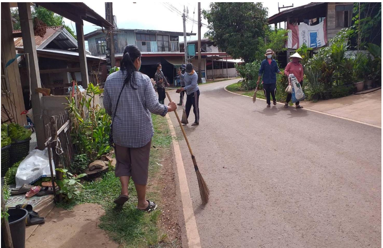
ภาพที่ 13-14 กิจกรรมรณรงค์ทำความสะอาดที่พักอาศัย (บ้านเรือน) ให้ถูกลักษณะ และปรับปรุงภูมิทัศน์ในหมู่บ้านให้สวยงามอย่างต่อเนื่อง ประจำเดือนเมษายน 2565