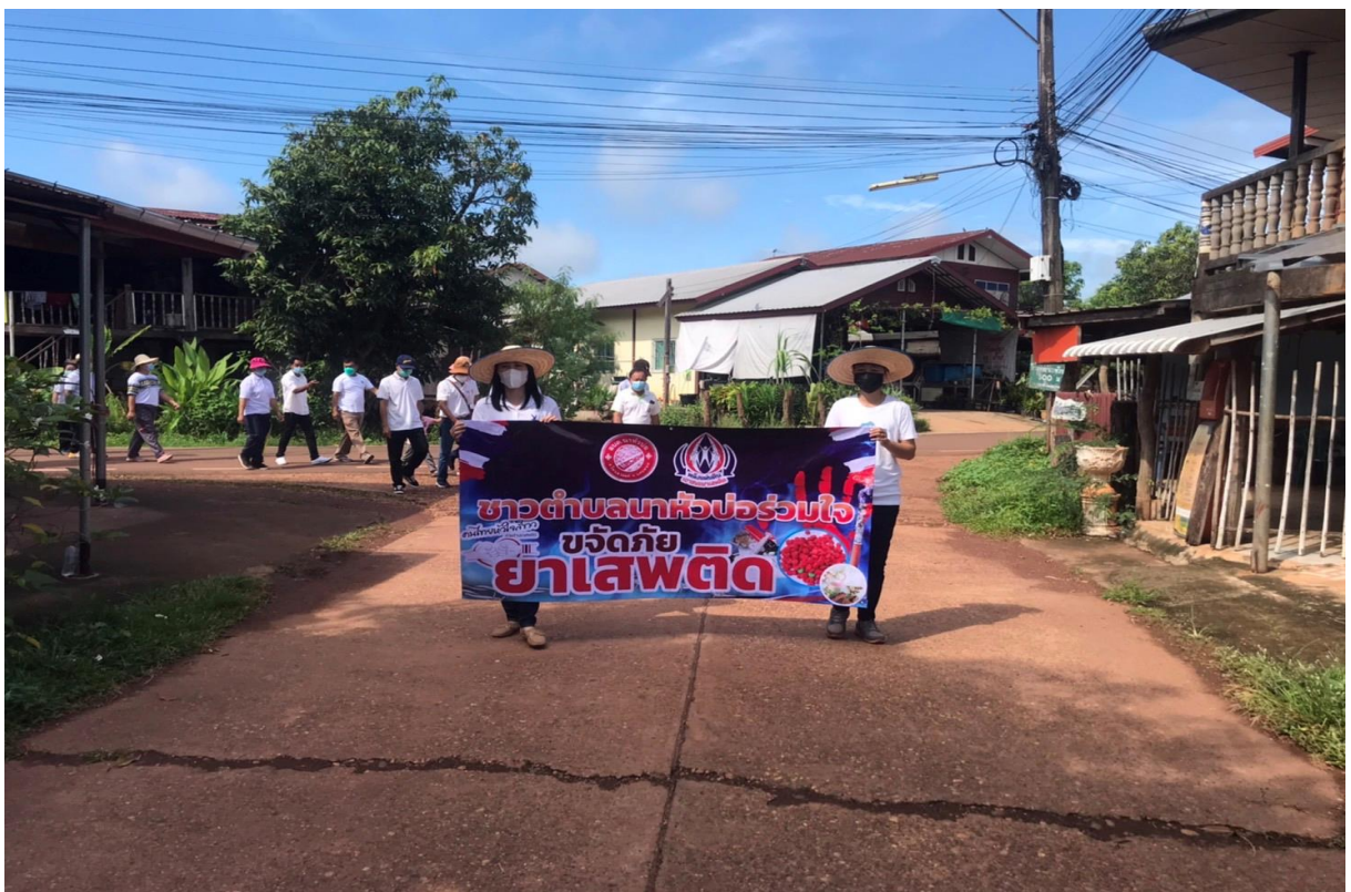
ภาพที่ 11-12 กิจกรรมต่อต้านยาเสพติดโลก