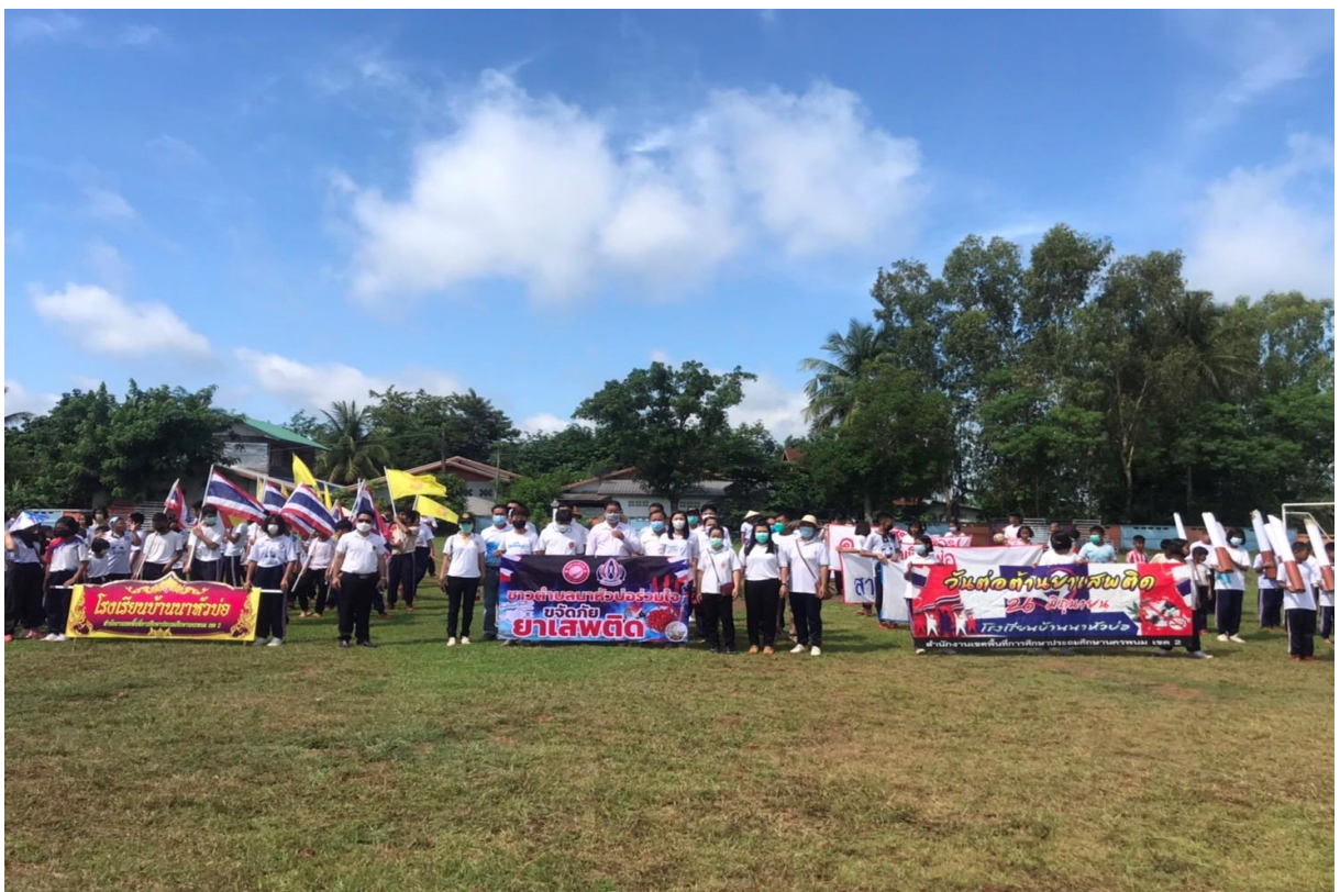
ภาพที่ 9-10 กิจกรรมต่อต้านยาเสพติดโลก