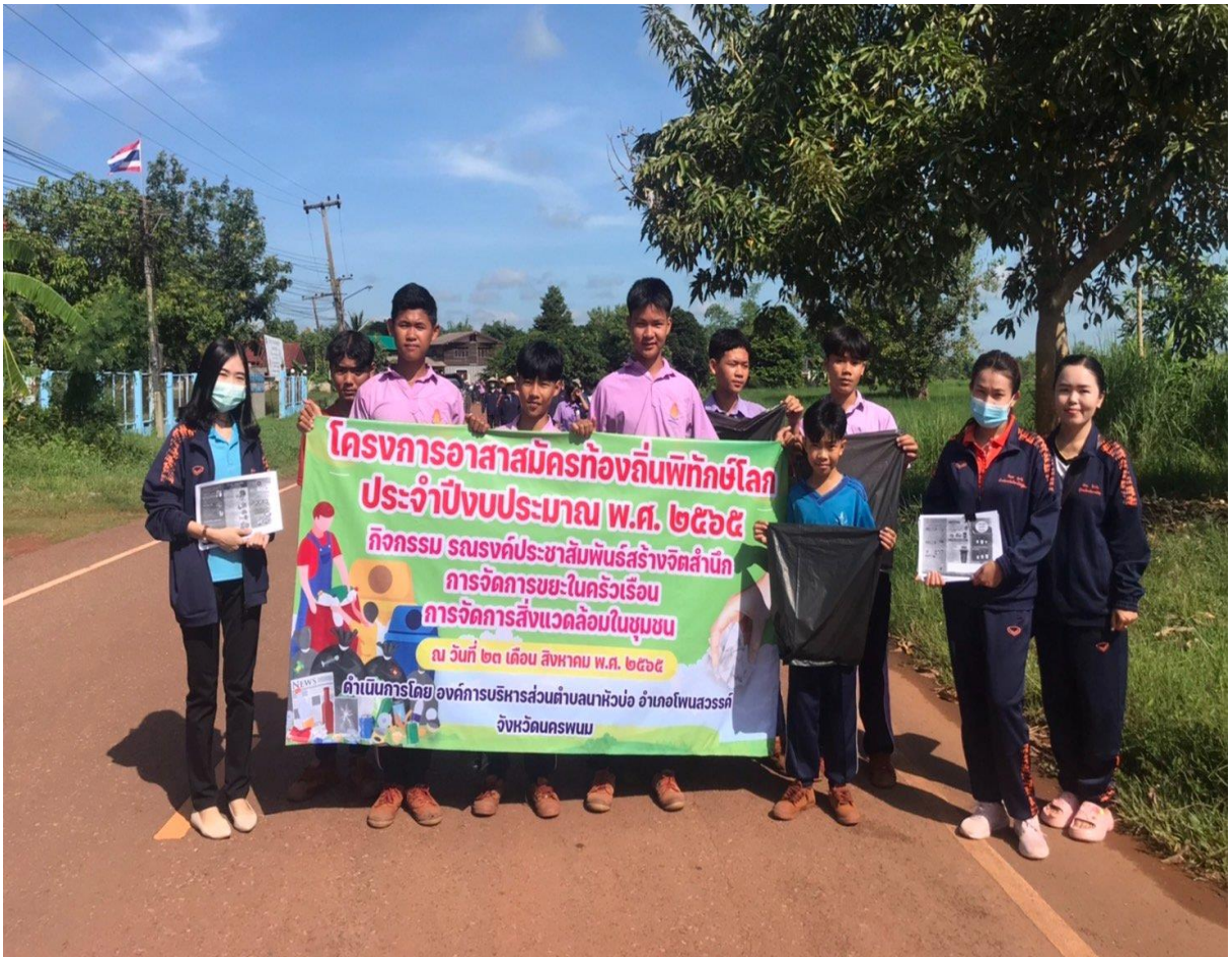
ภาพที่ 19-20 กิจกรรมโครงการอาสาสมัครรักษาดินแดน ประจำปีงบประมาณ พ.ศ. 2565