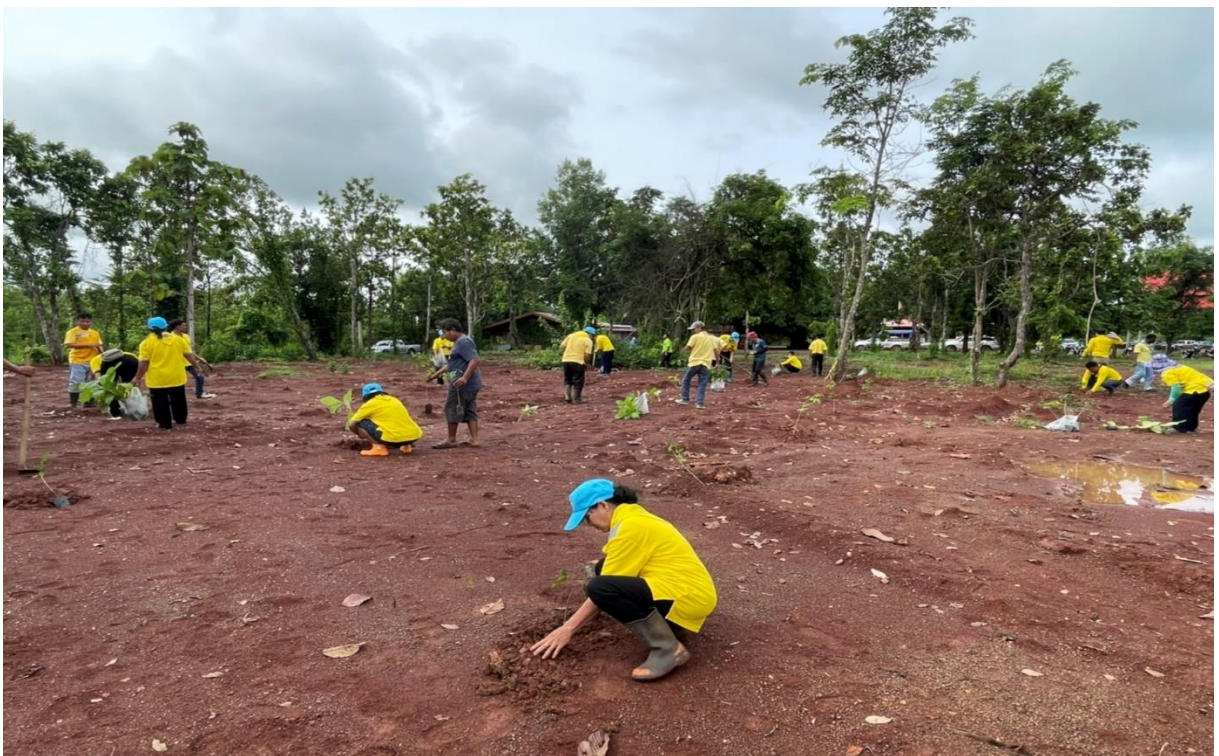
ภาพที่ 1-2 กิจกรรมปลูกต้นต้นไม้ ตามโครงการท้องถิ่นปลูกป่าเฉลิมพระเกียรติสมเด็จพระนางเจ้าสิริกิติ์ พระบรมราชินีนาถ พระบรมราชชนนี พันปีหลวง "รวมใจท้องถิ่น ปลูกต้นไม้เพื่อแผ่นดิน สืบสานสู่ 90 ล้านต้น"