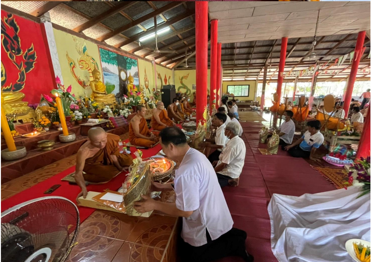
ภาพที่ 7-8 กิจกรรม โครงการจัดงานประเพณีวันเข้าพรรษา ประจำปีงบประมาณ พ.ศ. 2565