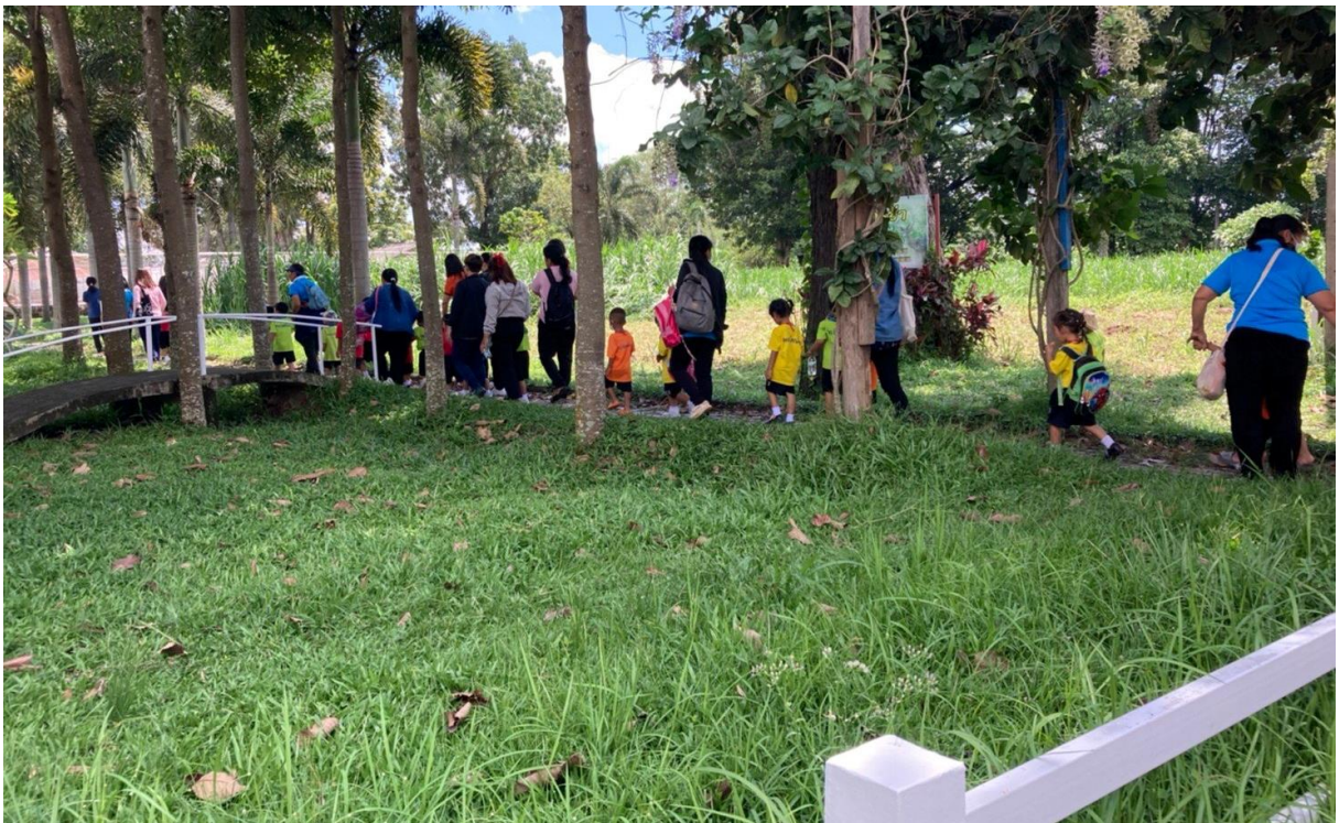
ภาพที่ 19-20 โครงการทัศนศึกษาแหล่งเรียนรู้นอกสถานที่ของศูนย์พัฒนาเด็กเล็ก เพื่อให้เด็กได้พัฒนาเรียนรู้ สร้างเสริมประสบการณ์ตรงให้กับเด็กเพิ่มเติมจากการเรียนในห้องเรียน ณ ศูนย์ศึกษาการพัฒนาภูพาน อันเนื่องมาจากพระราชดำริ จังหวัดสกลนคร