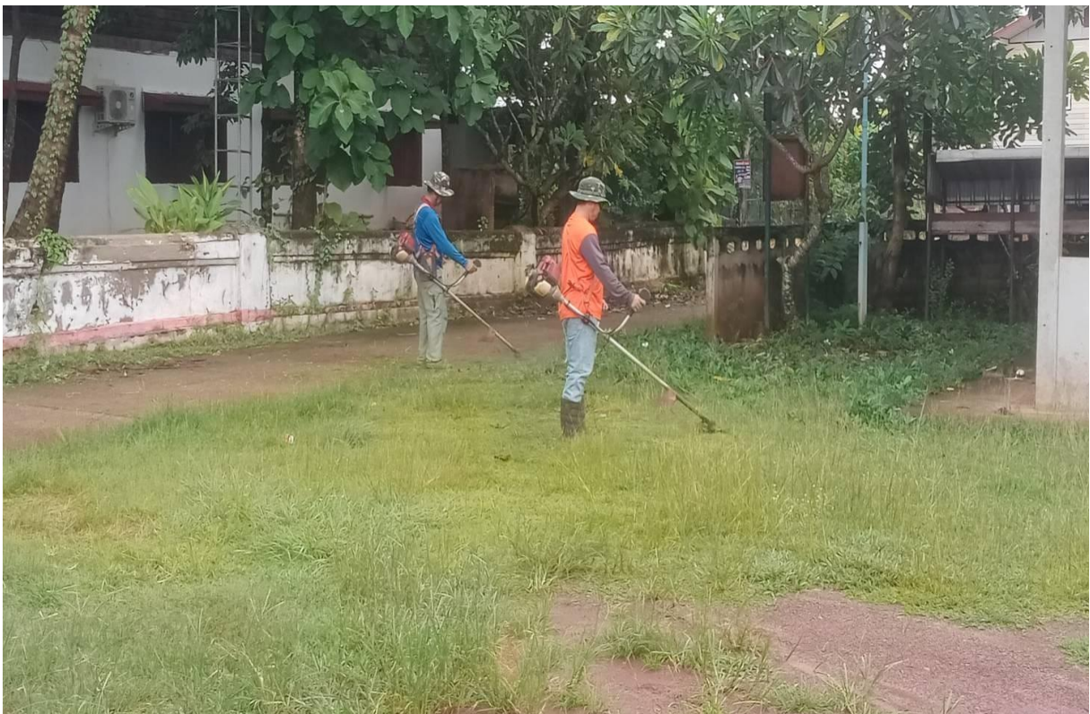
ภาพที่ 15-16 กิจกรรมรณรงค์ทำความสะอาดที่พักอาศัย (บ้านเรือน) ให้ถูกลักษณะ และปรับปรุงภูมิทัศน์ในหมู่บ้านให้สวยงามอย่างต่อเนื่อง ประจำเดือนเมษายน 2565